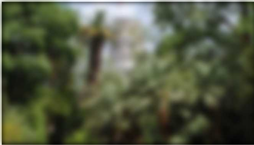
L'Orto botanico di Pisa

Pisa, 19 gennaio 2021 - Porte finalmente aperte. Il Museo di Storia Naturale e l'Orto e Museo Botanico dell'Università di Pisa possono nuovamente accogliere il pubblico.